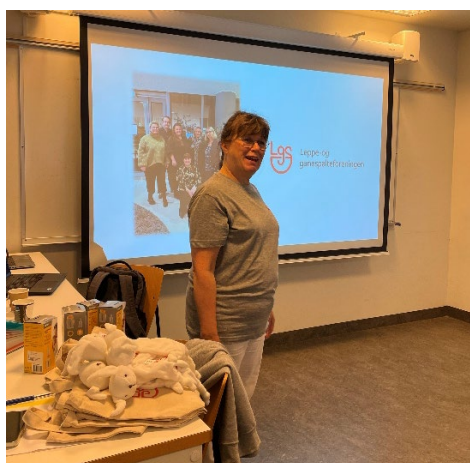
Bildet fra et av dagskursene på Rikshospitalet.

Foreningen er månedlig representert på dagskurs for nybakte foreldre på Rikshospitalet og Haukeland. Der presenterer vi foreningen og arbeidet vi gjør samt deler ut velkomstpakke til foreldrene.